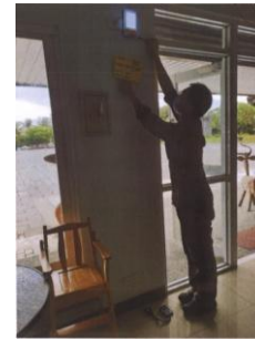
緊急照明燈移位設置照片