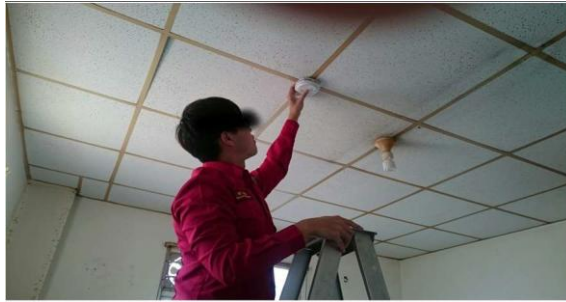
裝設住宅用火災警報器照片