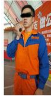
緊急廣播設備關閉，加配 2 個手提式擴音器、配備 3 個無線電對講機照片